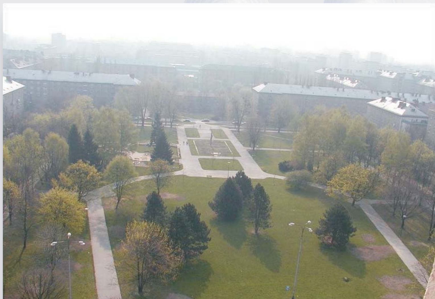
zatížení z dopravy Ostrava-Poruba, Havlíčkovo nám., tichá lokalita